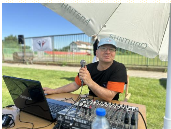
Водитељ програма и техничка подршка: Милорад Баста